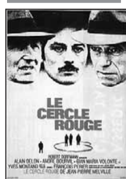
Rendez-vous jeudi prochain pour le troisième volet de cette série, avec le Cercle rouge .