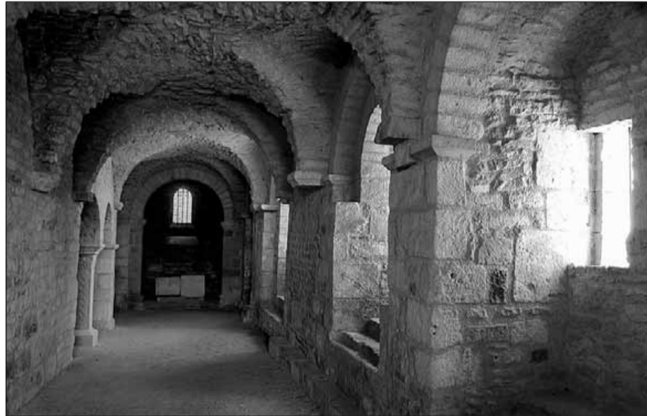
Bien que réputée pour son abbaye et ses ans, Flavigny n'a pas boudé le Chocolat

De tous les tournages effectués en Côte-d'Or, celui du Chocolat a sans doute été le plus intense. Il a duré trois semaines durant lesquelles le village de Flavigny-sur-Ozerain a vécu dans une autre dimension.