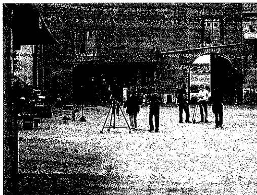
Tournage à l'Abbaye de La Prée